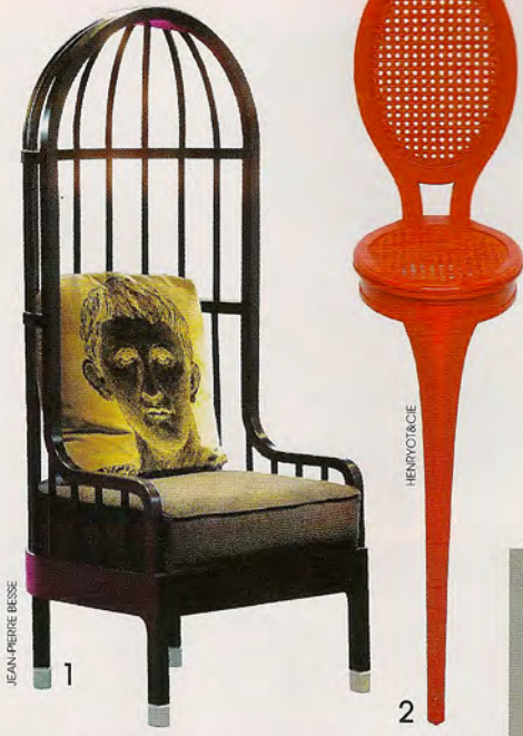
1. Cage pour les Casino Barrière, fabriqué par Jean-Pierre Besse. 2. La Miséricorde, Stéphane Plassier pour la collection H d'Henryot & Cie. 3. Chapelle, Grégory Lacoua et Jean-Sébastien Lagrange pour les religieuses de l'Assomption à Paris, édité par Oxyo et fabriqué par Sièges

De la bille de bois aux assises contemporaines, l'exposition du musée de la Cour d'Or, à Metz, montre comment en Lorraine, l'industrie du siège a su évoluer avec son époque. Par Agnès Waendendries.