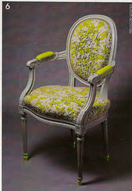
d'Art Français (SAF). 4. Chapelet de carcasses de sièges. 5. Hommage, Céline Lhuillier, fabriquée par les Ateliers Vidon Gerlier. 6. Feutre vert par Gildas François pour Le Coq & le Crapaud.