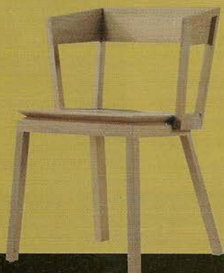
Chaise Chapelle (sièges d'art français), 2012