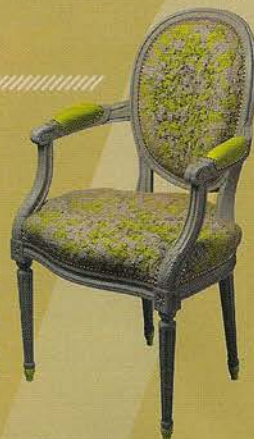
Fauteuil Feutre (Le Coq et Le Crapaud), 2012

Une chapelle qui, rappelons-le, est appelée à devenir la nouvelle entrée du Musée de La Cour d'Or en 2015.