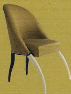
Chaise éléphant (Collection Pierre Counot Blandin), 2005